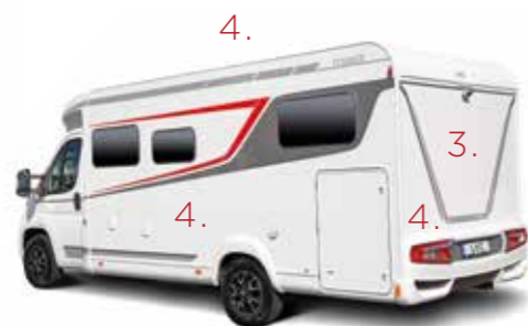
(vist her er Tourer T 660 G)